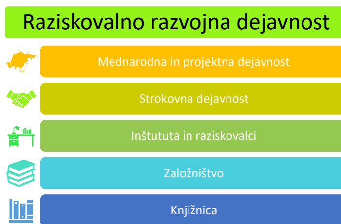
Slika 3: Organigram Raziskovalno razvojne dejavnosti na VŠR

Za raziskovalno razvojno dejavnost na VŠR je oblikovana Komisija za raziskovalno razvojno dejavnost. Člani Komisije so: